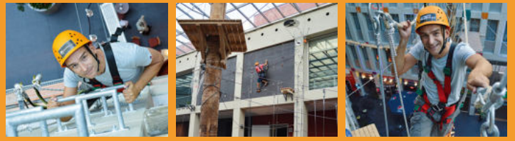
6) Begehbar ab 12 Jahren

BergWerk.FREIFALL Die Indoor-Weltneuheit Spektakulärer Sprung aus 12 Meter Höhe!